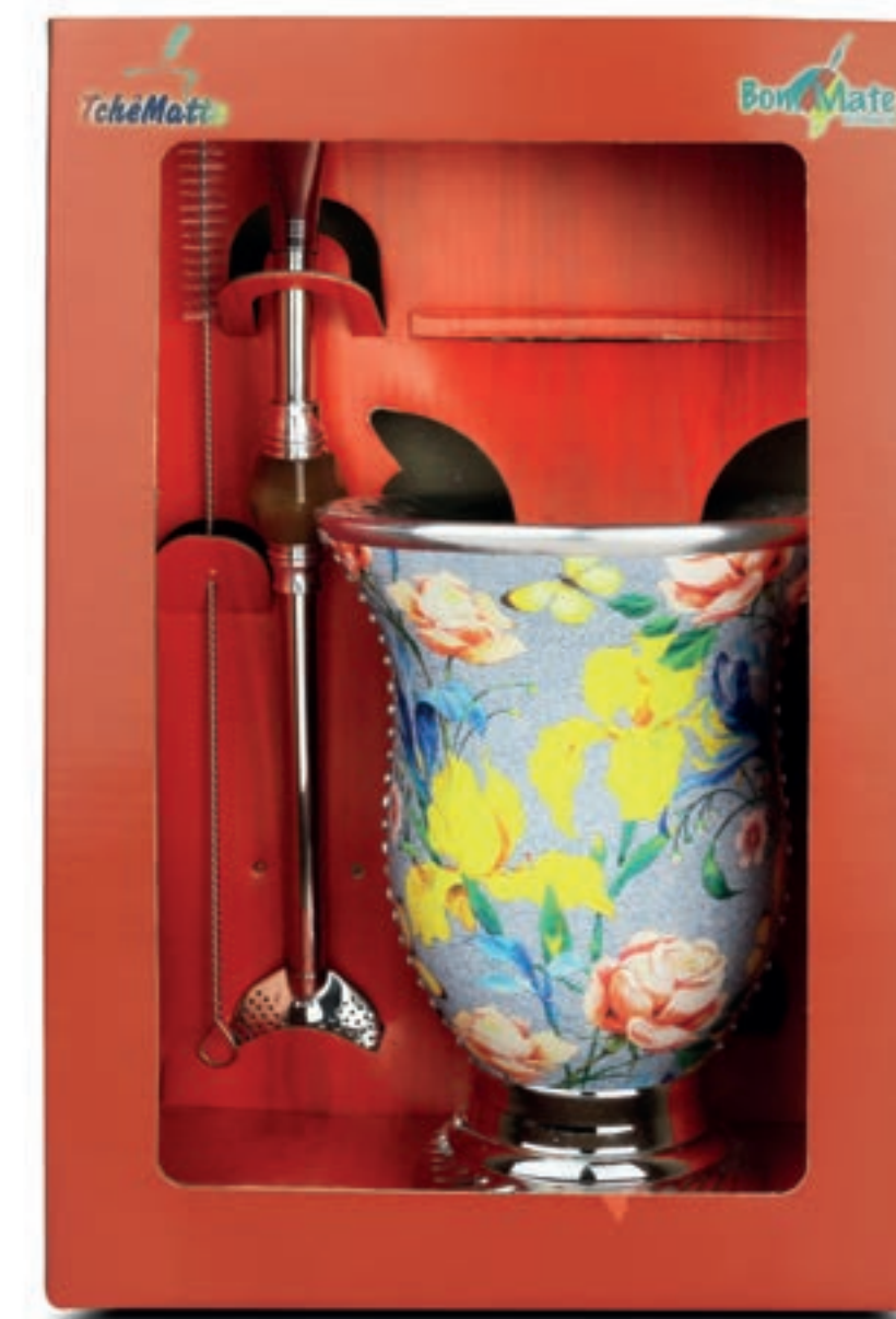
Kit 1 CUIA + BOMBA DE INOX COM ROSCA + ESCOVA PARA BOMBA