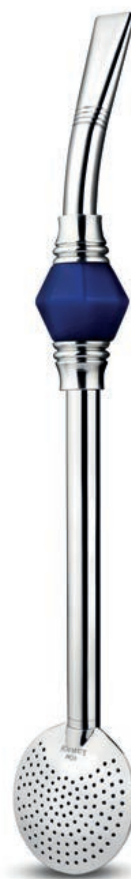
C/ ROSCA E SEM BIQUEIRA