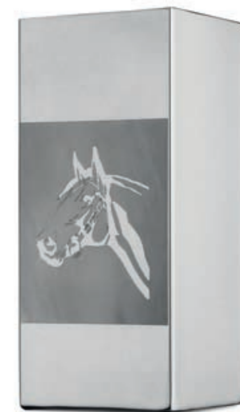
COPOS PARA TERERÉ