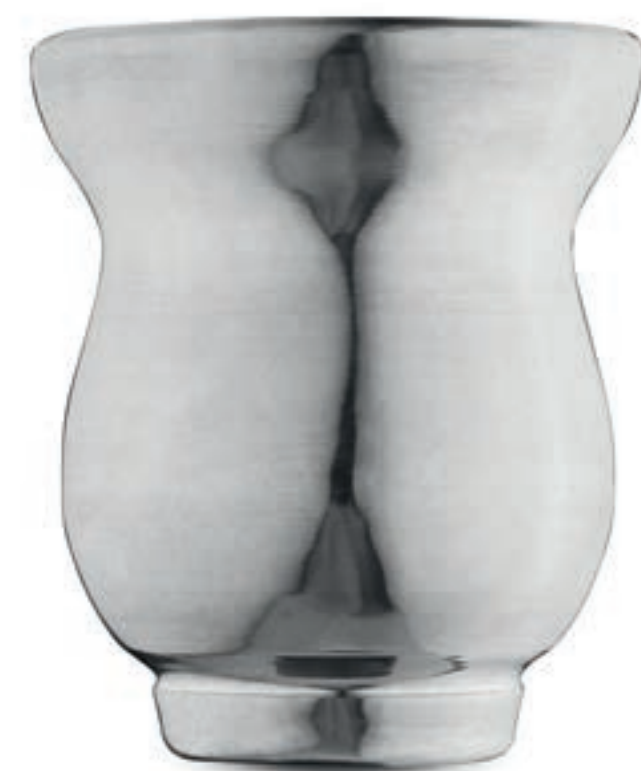
CUIAS PARA CHIMARRÃO