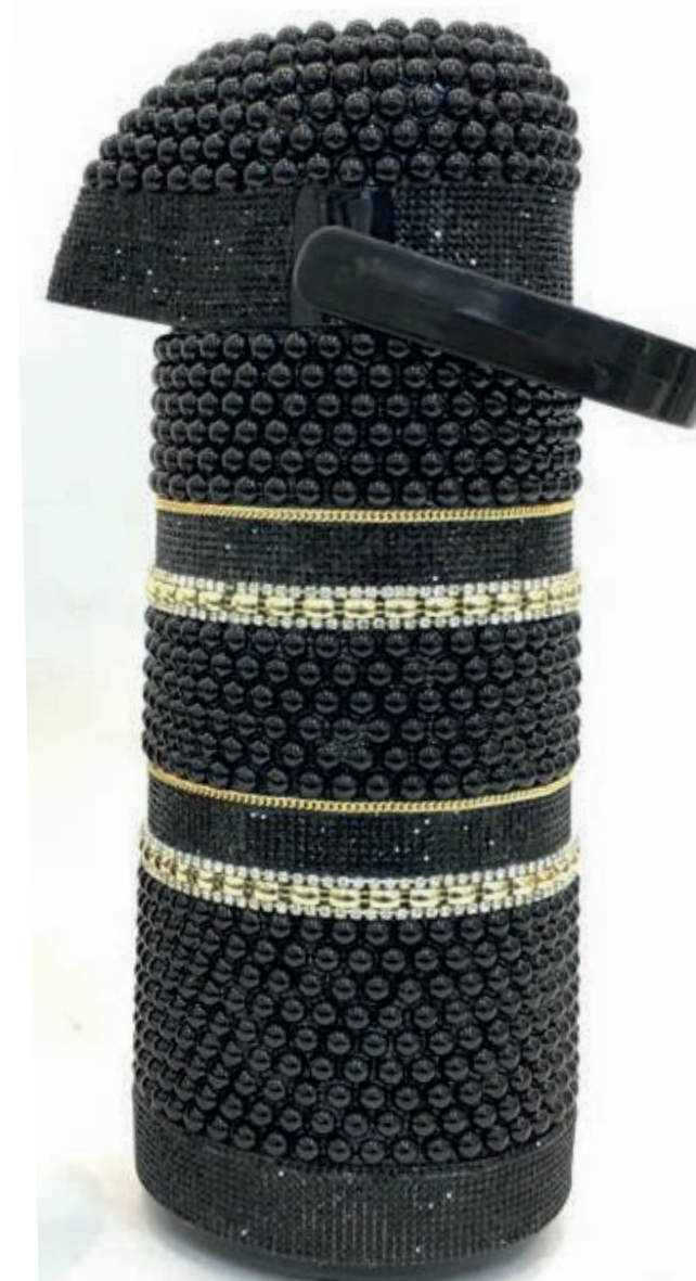
GARRAFAS TÉRMICAS DE PÉROLA