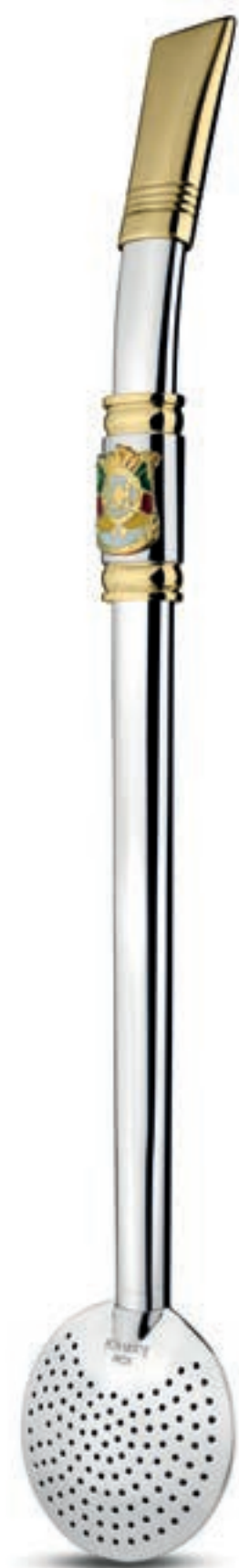
BANHO DE OURO 24K