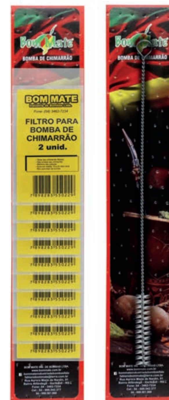
FILTRO E ESCOVAS