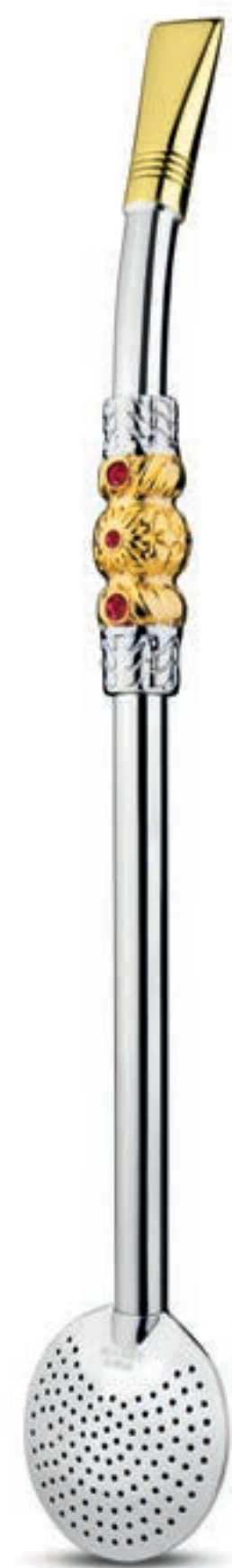
GOLD - ALPACA