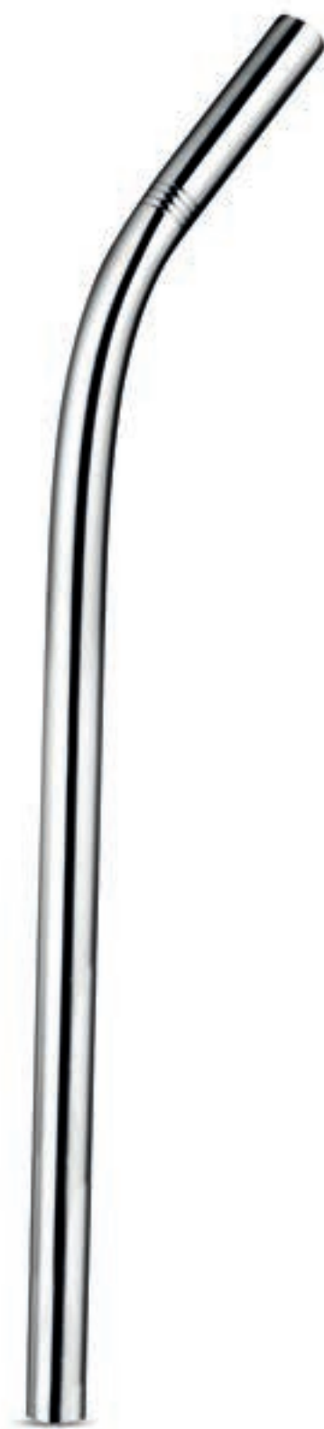
CANUDO EM INOX