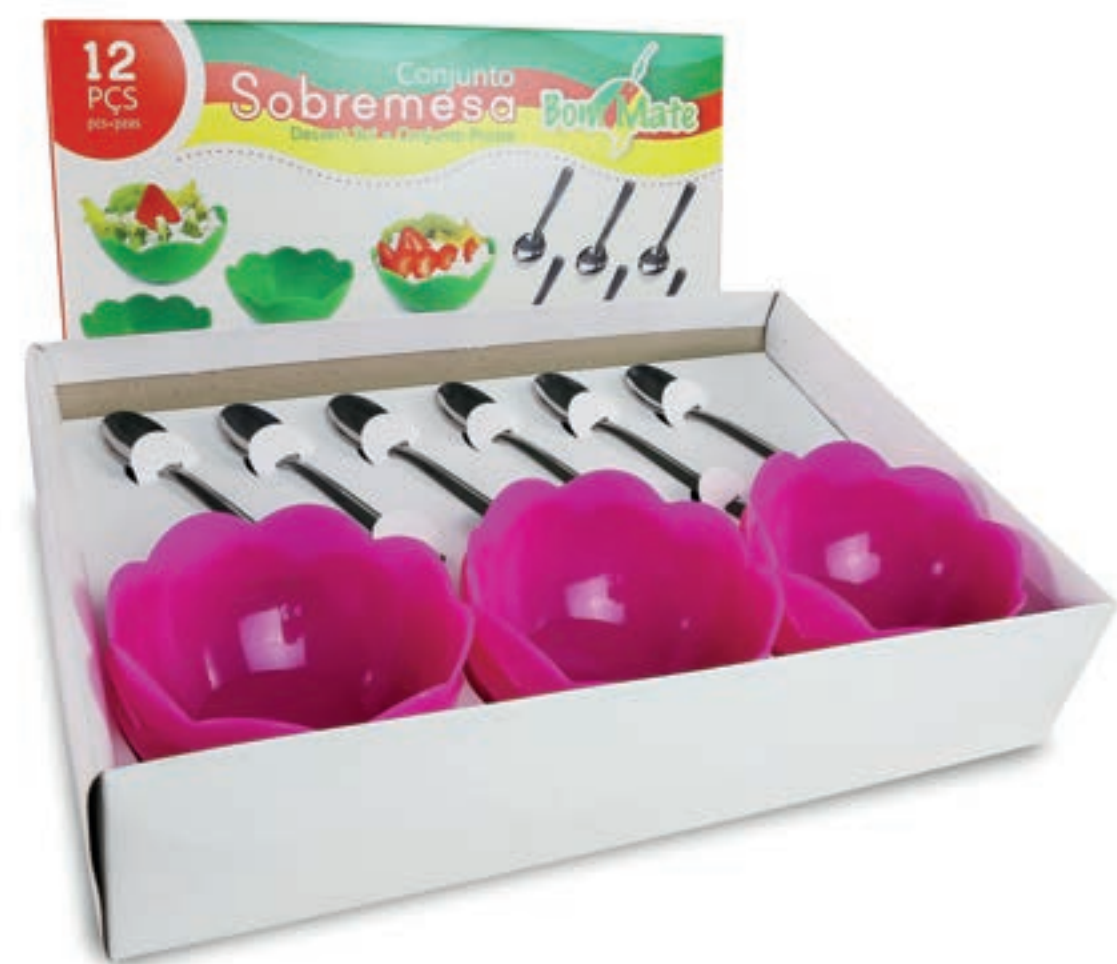
CUMBUCAS PARA SOBREMESA