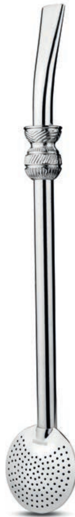
SUPER - FERRO CARBONO